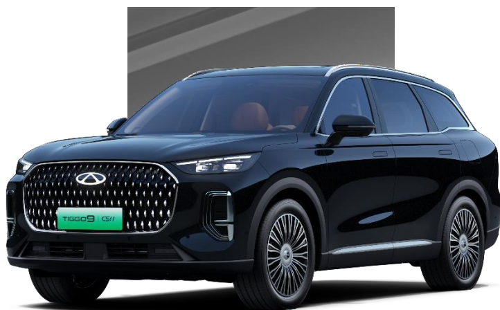
Pine Black (CLM)