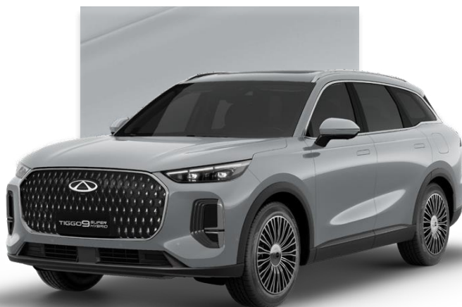
Tech Gray (GXM)