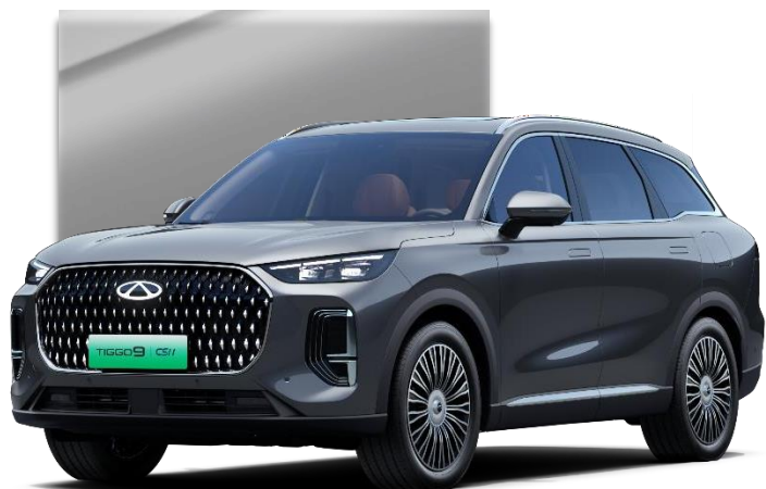
Universe Gray (UEM)